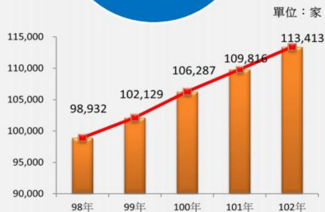
圖 1 98 年~102 年我國餐飲業之營利事業家數

根據過去 5 年的統計數字可發現，我國整體餐飲業的家數呈逐年成長的趨勢，近年來家數的成長幅度大約在 3%~4% 之間，99 年時整體的家數已突破 10 萬家，至 102 時已達 11 萬家。