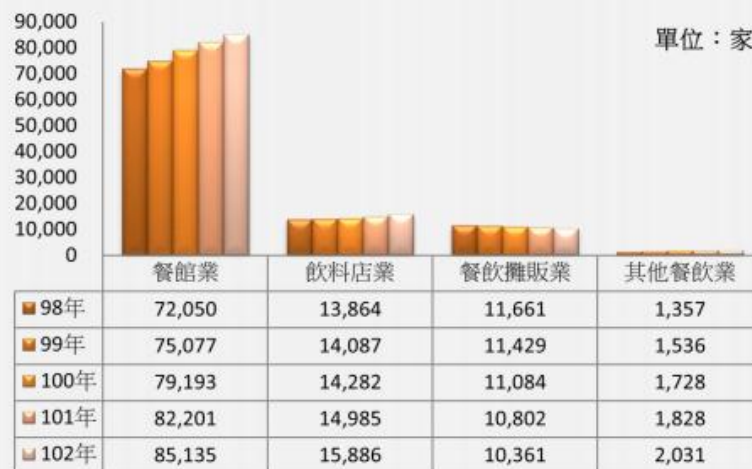
圖 4 98 年~102 年我國各餐飲產業別之營利事業家數

若進一步從餐飲業中的餐館業、飲料店業、餐飲攤販業以及其他餐飲業各細產業別來看，則可發現以餐館業家數最多，其次則為飲料店業。而在家數的成長情形方面，從近 5 年的資料可發現，除餐飲攤販業者家數增幅自 98 年以來逐年下降之外，其餘各類別的家數均逐年成長。